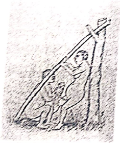
शंकराची मूर्ती प्रभावपुरा